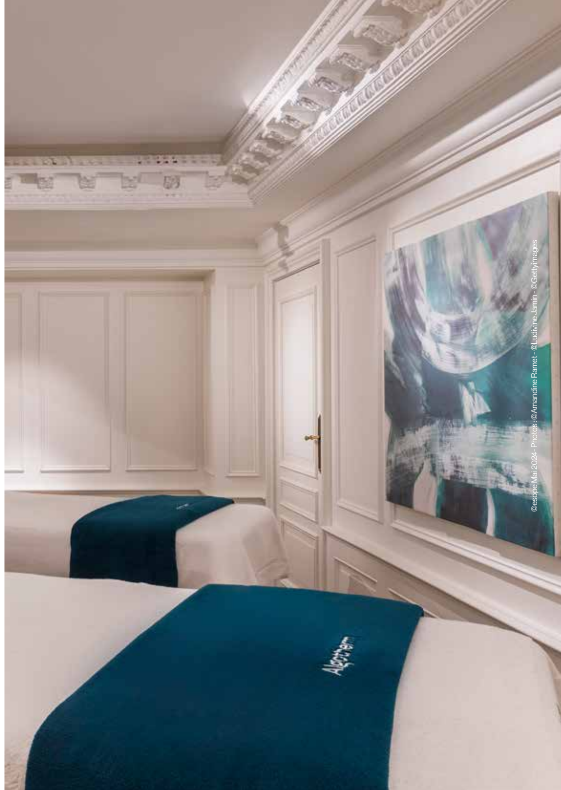
© esope Mai 2024 - Photos : ©Amandine Ramet - © Ludvine Jamin - © Gettyimages

Spa treatments are intended exclusively for people in good health. Please inform us of any health issues, allergies or injuries that might interfere with your treatment or use of the spa. In the case of doubt please contact your doctor before making any spa appointment. The spa is a non medicalised environment and all programmes administered have your well-being as their sole aim. Our massages and treatments are neither medical nor therapeutic. Under no circumstances can they totally or partially replace or be considered a substitute for medical, therapeutic or physiotherapy treatments. The term « massage » may also be used to describe body sculpting, carried out using different techniques.