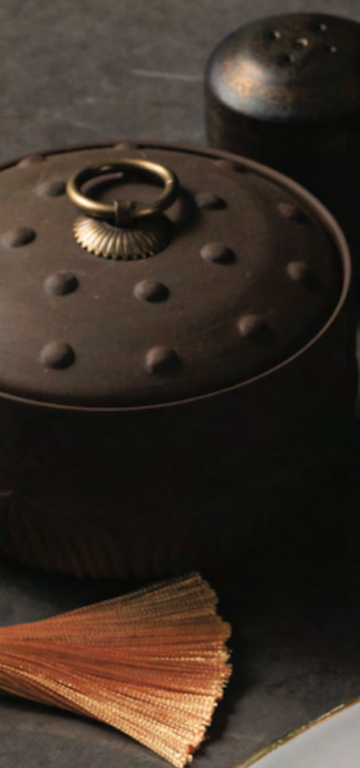
Steamed Lobster with Garlic Sauce 蒜蓉粉丝蒸波士顿龙虾 กุ้งล็อบสเตอร์นึ่งซอสกระเทียม