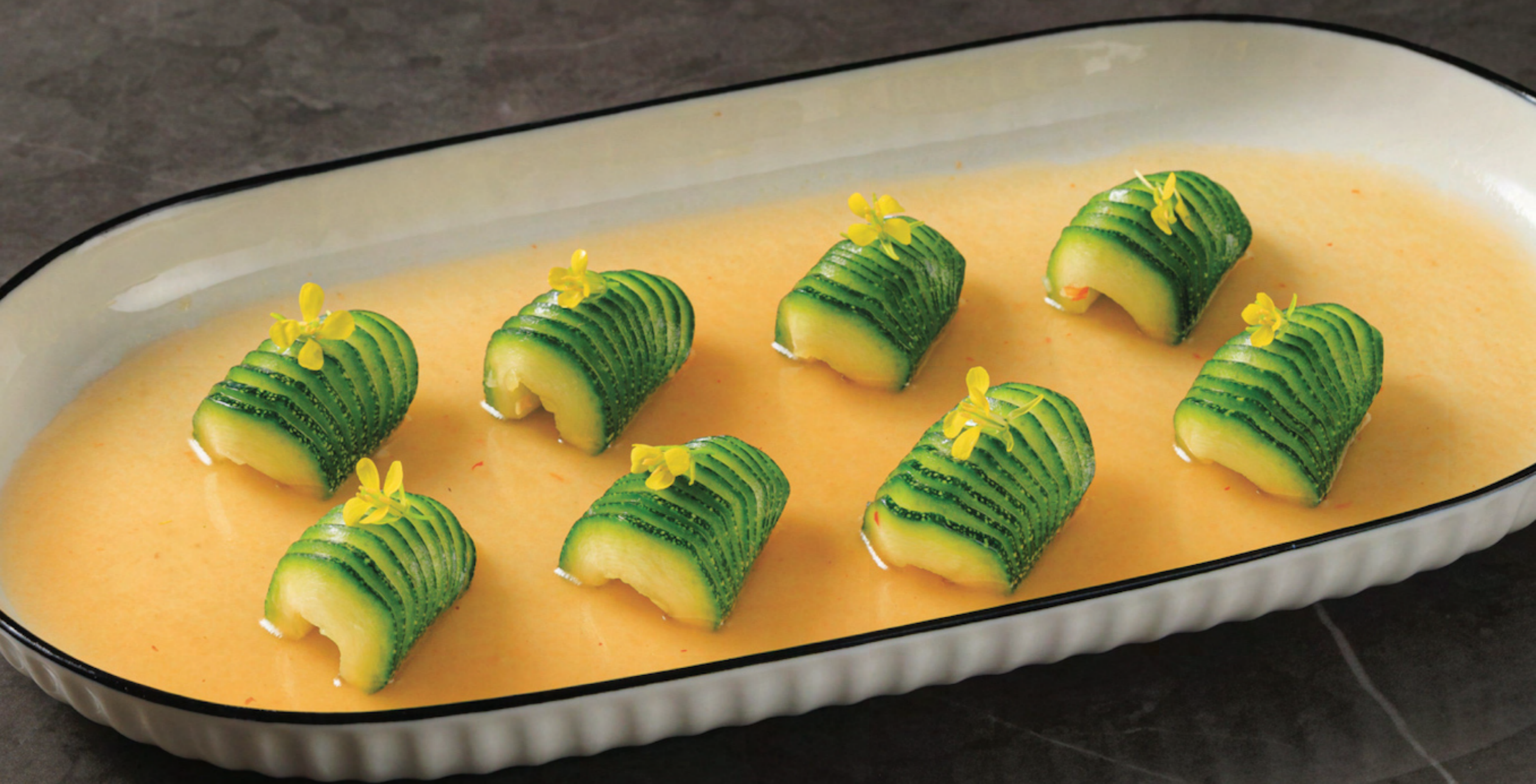
Hot and Sour Zucchini 酸辣节瓜 ဗုပုဏ်းအါတဲါဆေဝု