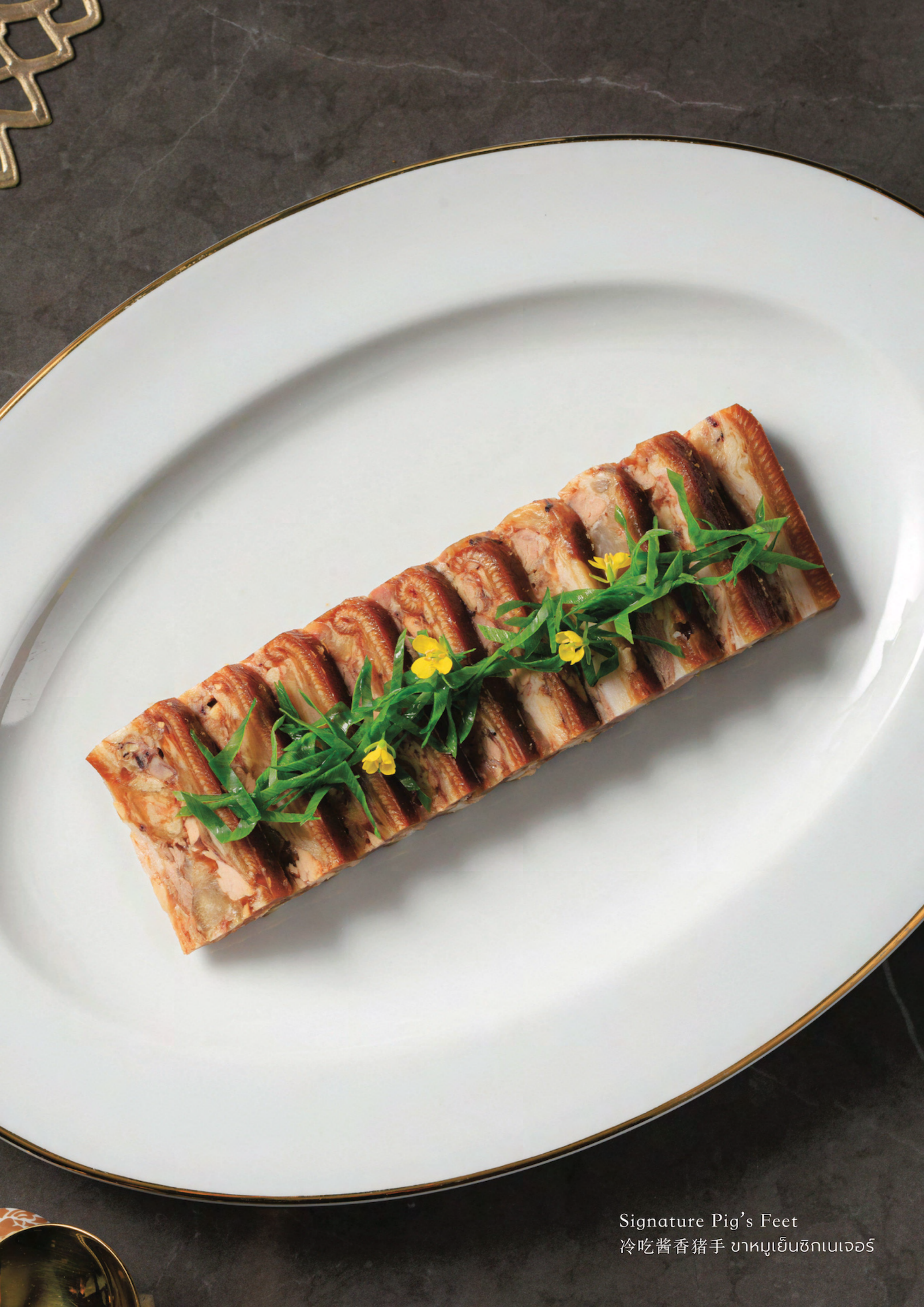
Signature Pig's Feet 冷吃酱香猪手 บาทมุเย็นซึกเนเจอร์