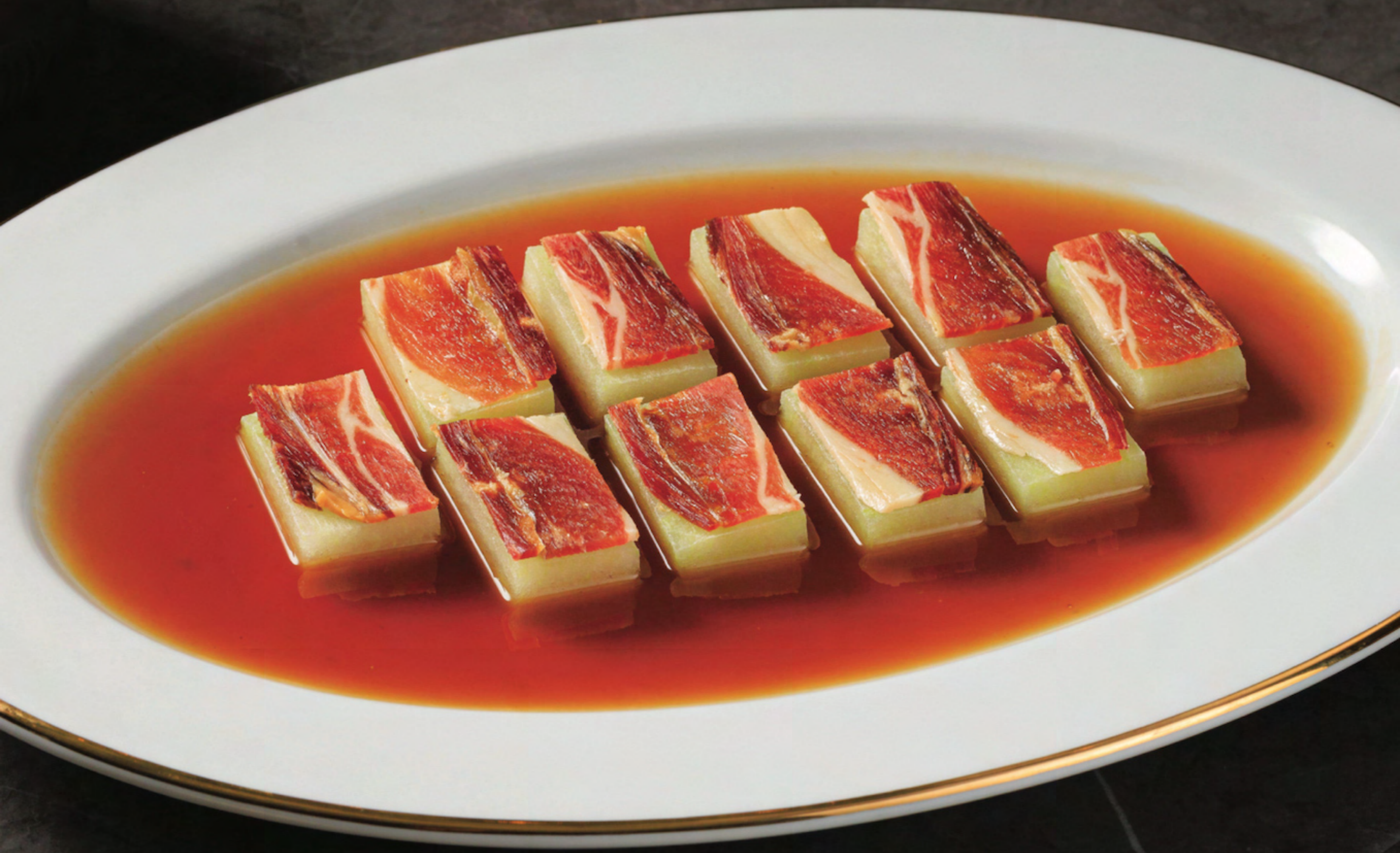
Braised White Gourd with Ham 鮑汁冬瓜焗火腿 พักจุ่มและแอม