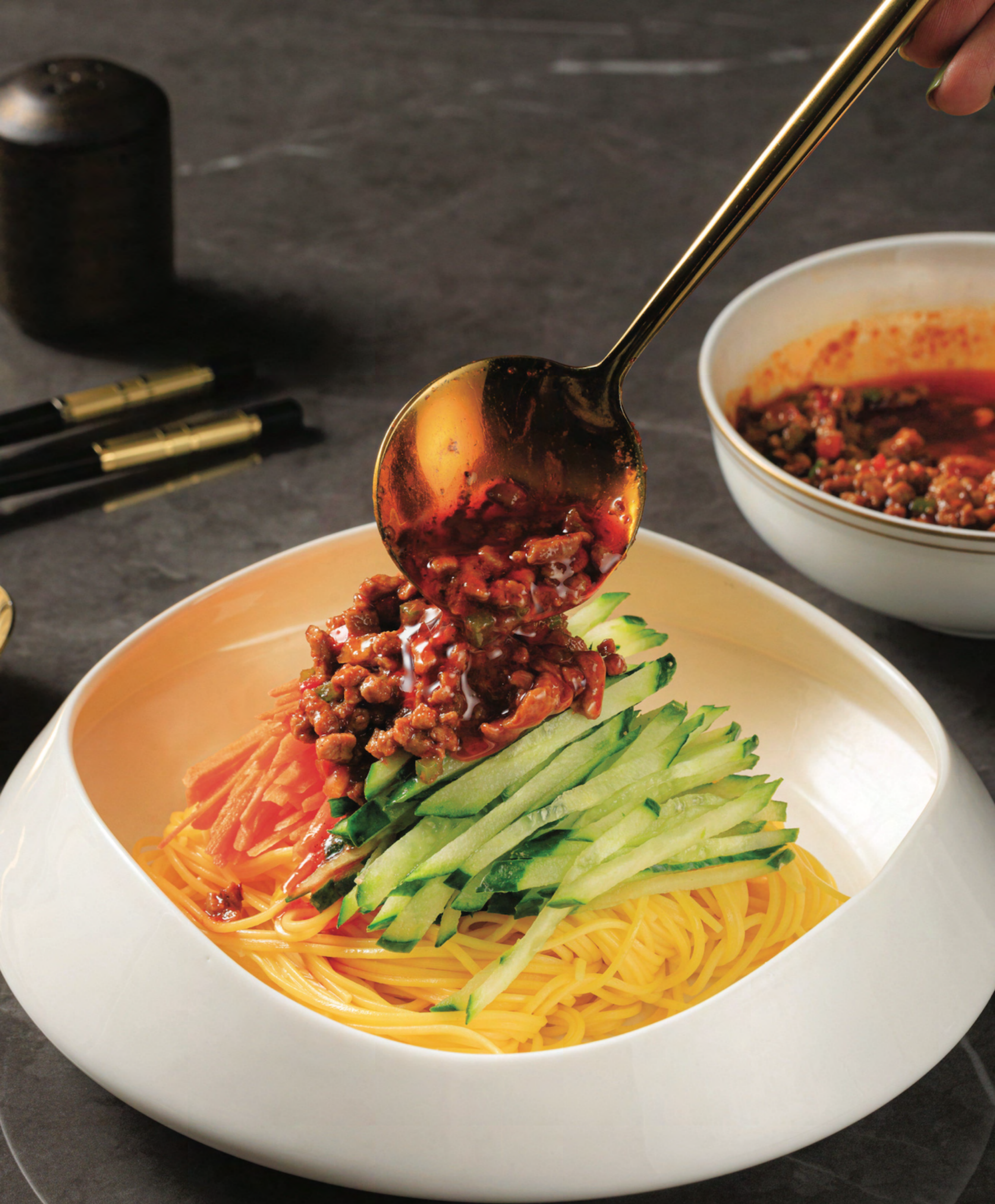
Noodles Served with Bean Sauce, Minced Pork 炸酱面 ก๋วยเตี๋ยวเสิร์ฟกับซอสตัวหมูสับ