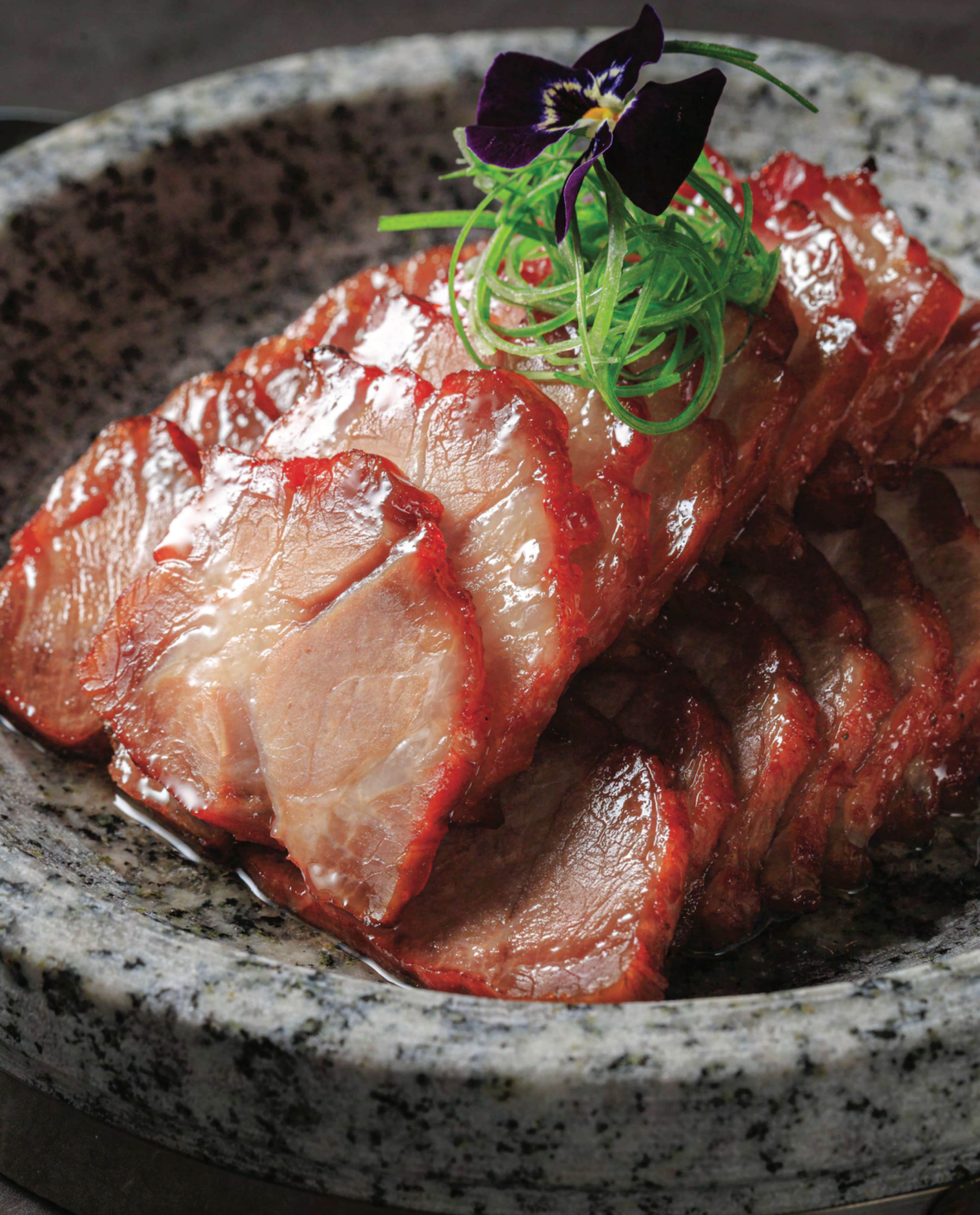
Honey-Stewed BBQ Pork 蜜汁叉烧 หมูอบบาร์บีคิวซอสน้ำผึ้ง