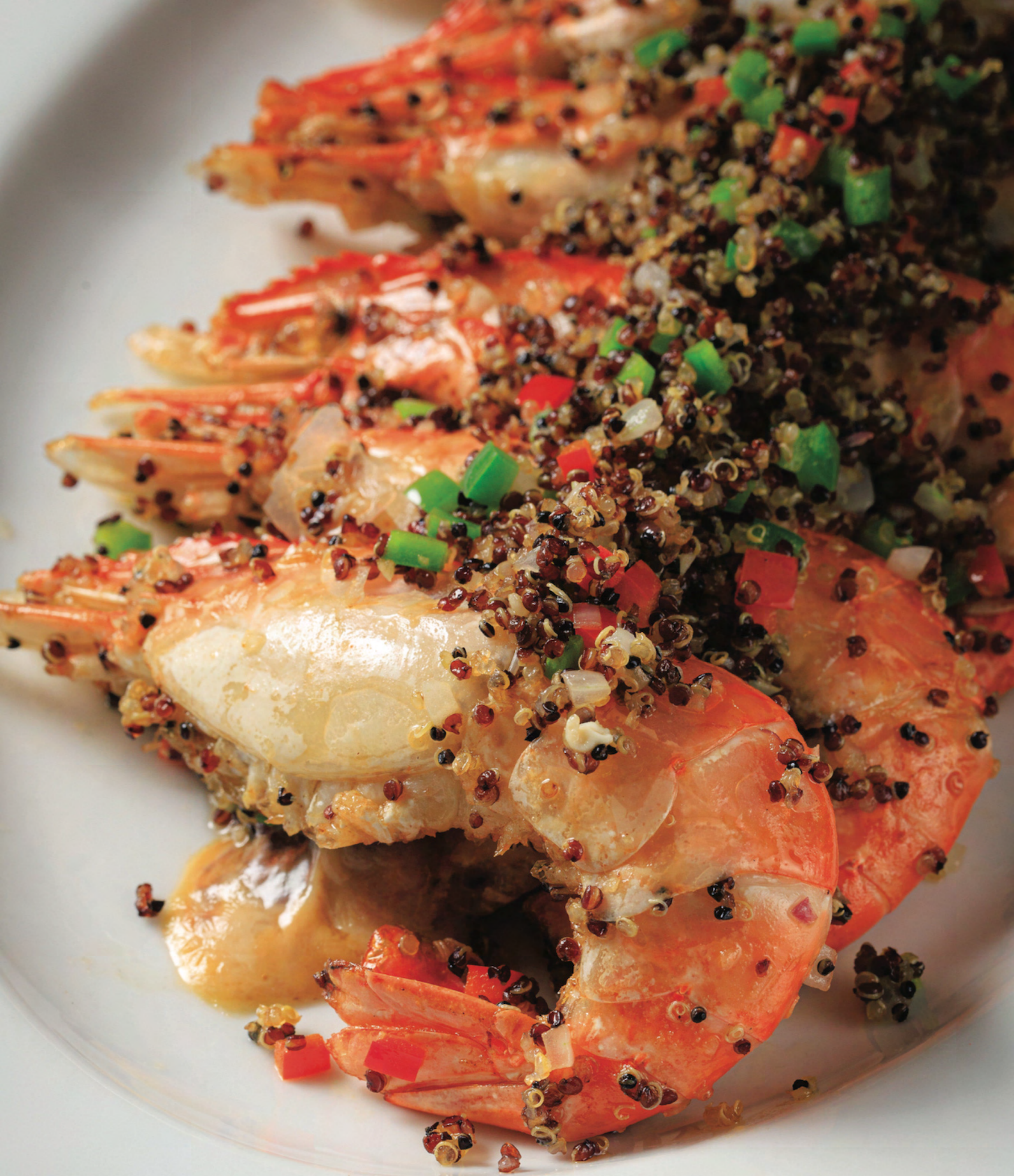
Stir-fried River Prawns with Quinoa 藜麦爆河虾 กุ้งแม่น้ำทอดกับควินัว