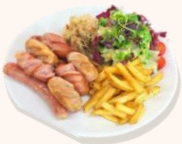
모듬 소세지 플레터