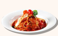
해산물 토마토 파스타