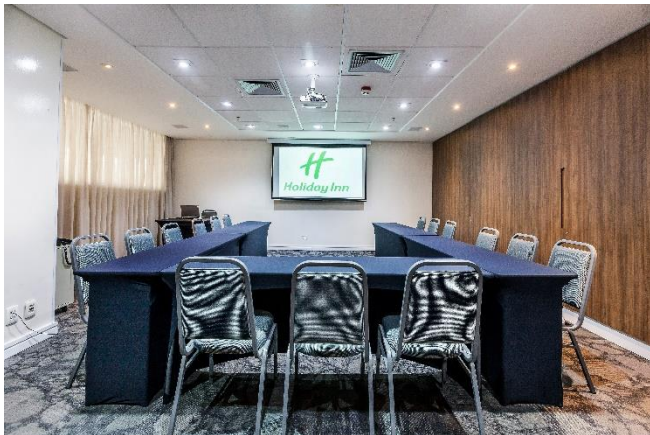
Click or tap here to enter text.