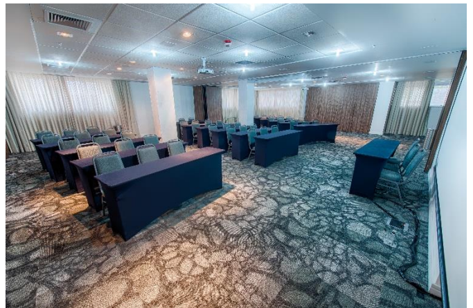
Click or tap here to enter text.