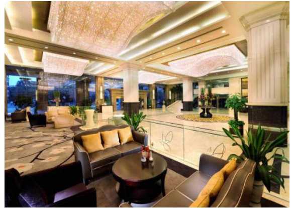
中庭咖啡厅 酒店大堂